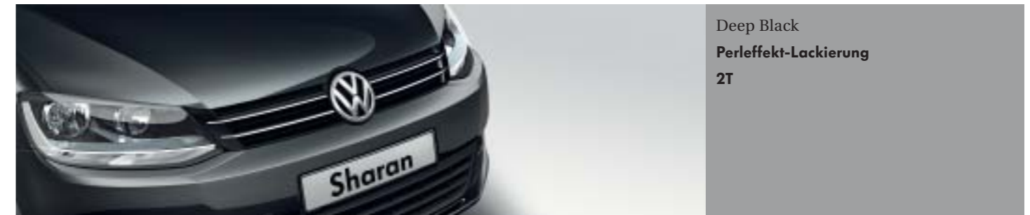
Deep Black Perleffekt-Lackierung 2T