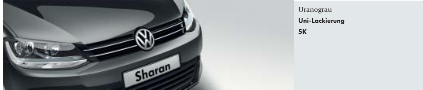
Uranograu Uni-Lackierung 5K

Die Entscheidung, welche Farbe am besten zu Ihnen passt, können wir Ihnen natürlich nicht abnehmen. Die Vielfalt macht die Auswahl vielleicht schwer, aber sie ermöglicht es Ihnen auch, Individualität zum Ausdruck zu bringen. Doch egal, für welche Lackierung oder für welchen Sitzbezug Sie sich entscheiden, Brillanz in der Farbe, beste Materialqualität und hervorragende Verarbeitung wählen Sie in jedem Fall.