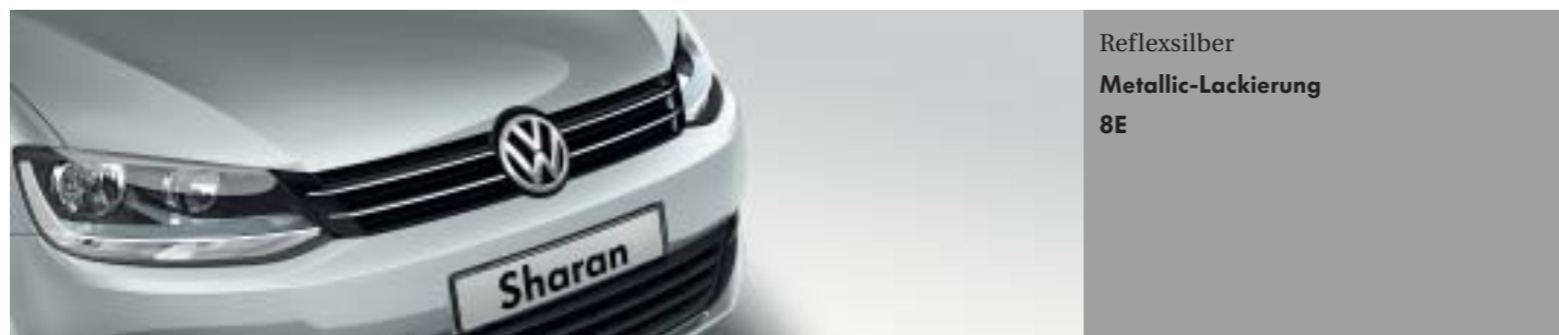
Reflexsilber Metallic-Lackierung 8E