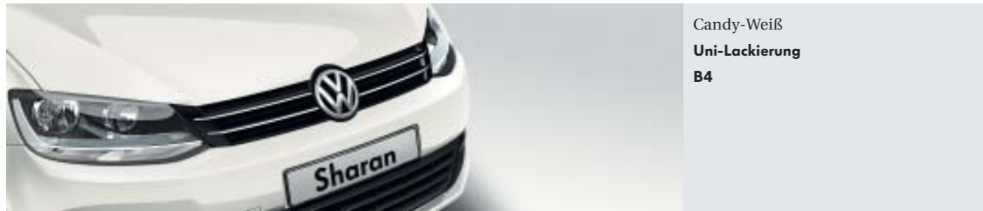
Candy-Weiß Uni-Lackierung B4