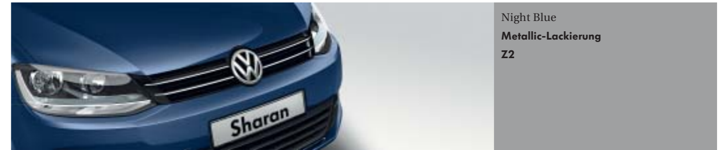
Night Blue Metallic-Lackierung Z2