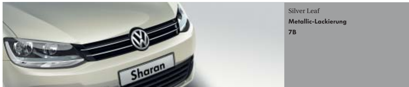
Silver Leaf Metallic-Lackierung 7B