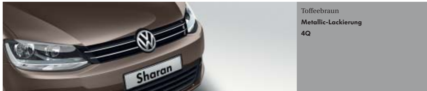
Toffeebraun Metallic-Lackierung 4Q