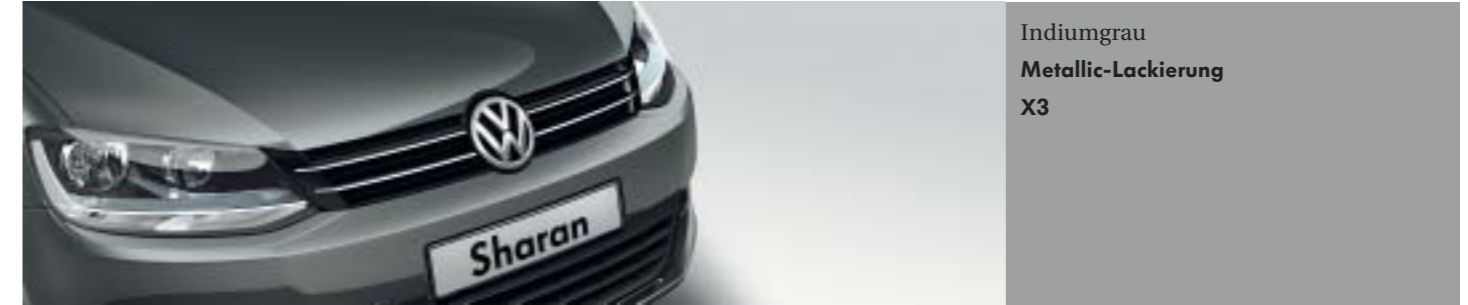
Indiumgrau Metallic-Lackierung X3