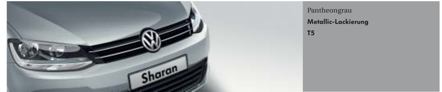
Pantheongrau Metallic-Lackierung T5